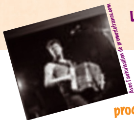
Avec l'assistance de promoteurmusic.com

L'artiste est souvent le premier touché : il gagnera moins, et ce sont les plus "petits" qui risquent de disparaître. Mais, il y a plus grave encore. Si tout devient gratuit, alors il n'y a plus d'argent pour découvrir de nouveaux talents et lancer de jeunes artistes. La diversité de la création artistique peut être menacée !